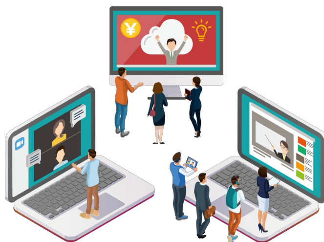
様々なオンラインサロンジャンルに合わせて決済方法を導入

「このオンラインサロンは学生向けのため、クレジットカードを持っていない会員もいる。コンビニ払いができる様になりたい」