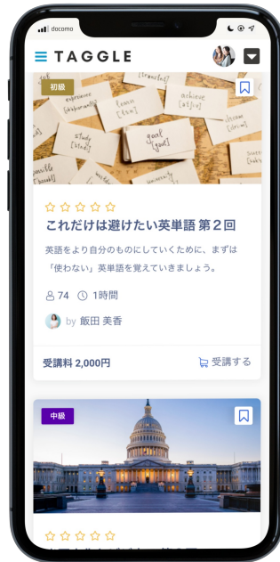
コース一覧イメージ