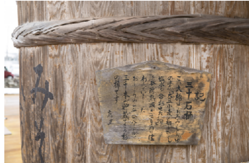
越後長岡の風情と芳香に浸る、醸造の町・摂田屋巡り 【2】星野本店～長谷川酒造編 | な！ナガオカ https://na-nagaoka.jp/nagaoka/5806

「かくら南蛮」は、新潟県長岡市で栽培されているとうがらしのことです。肉厚で大きく、一見小ぶりなピーマンに似ていますが、シシトウに似たピリッとした辛味があります。しわの寄ったゴツゴツとした形が神楽面に似ていることから、「かくらなんばん」と呼ばれるようになったといわれています。