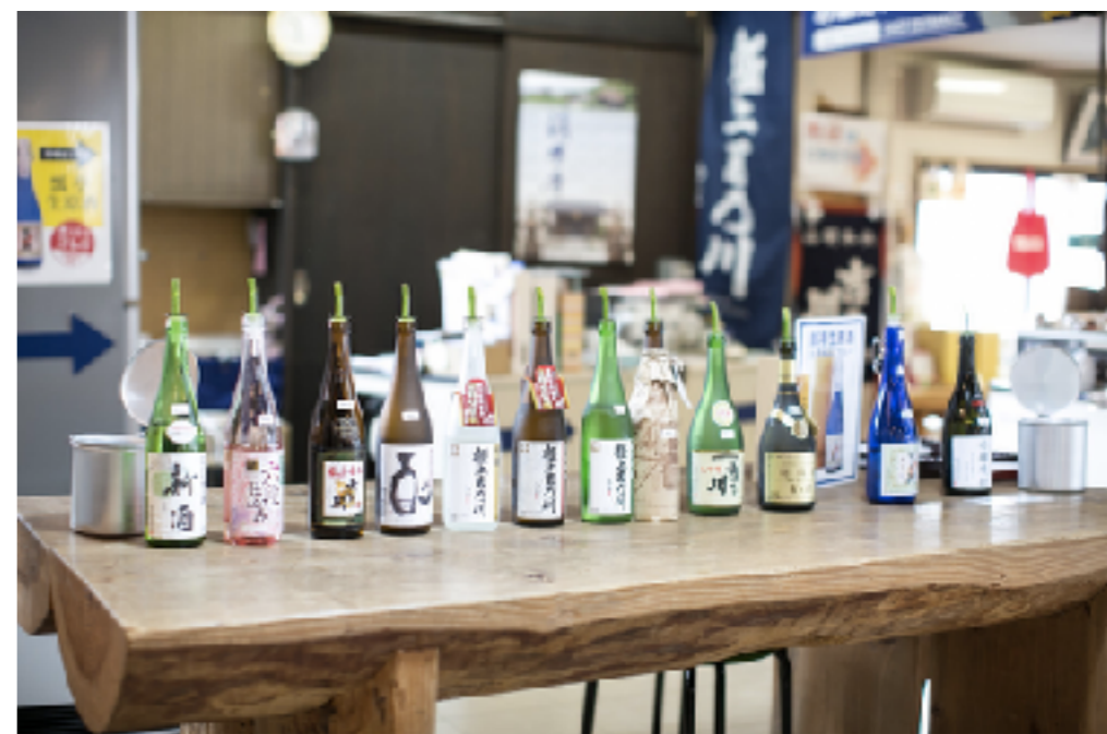
越後長岡の風情と芳香に浸る、醸造の町・摂田屋巡り 【1】越のむらさき～吉乃川編 | な！ナガオカ https://na-nagaoka.jp/nagaoka/5804