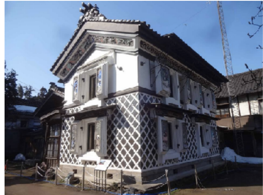
建築マニア必見！ 長岡が誇る名建造物「機那サフラン酒本舗」とは？ | な！ナガオカ https://na-nagaoka.jp/nagaoka/1505

中越地震で大きな損傷を受けていますが、「機那サフラン酒本舗保存を願う市民の会」が結成され、修復を目指して活動中です。現在は主屋や「日本一の鰻絵(こてえ)の蔵」の外観をご覧いただけます。