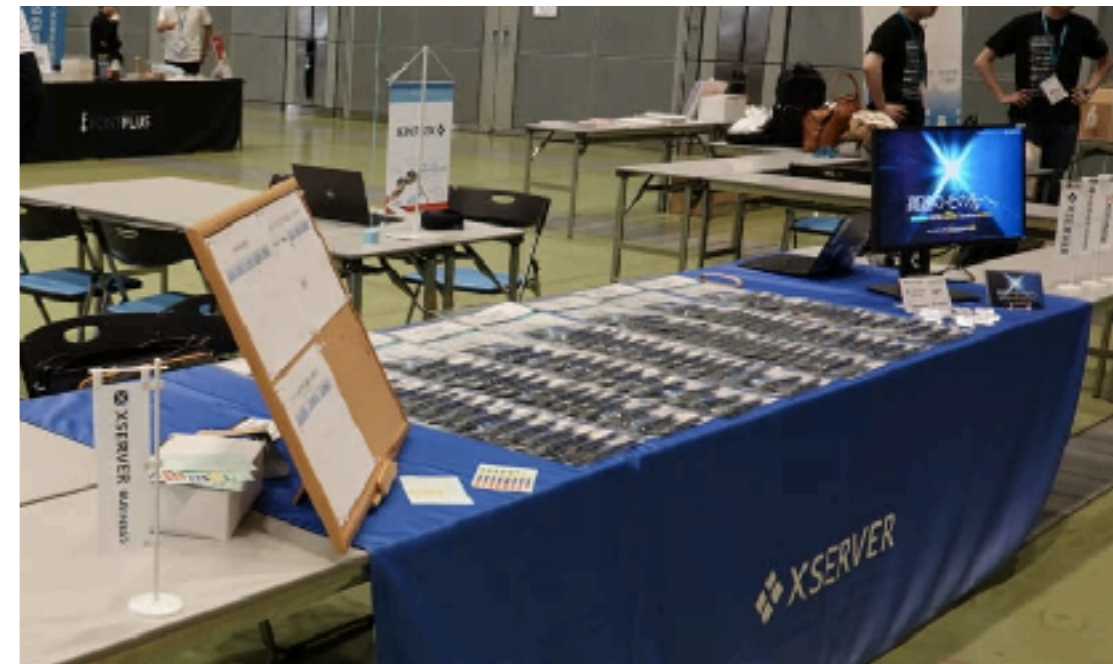
WordCamp Haneda 2019 のスポンサーブース (エックスサーバー様)