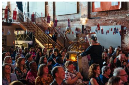
過去イベントの様様