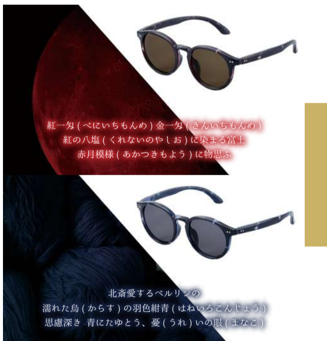
紅一匁(べにいちもんめ) 金一匁(きんいちもんめ) 紅の八塩(くれないのやしお)に染まる富士 赤月模様(あかつきもよう)に物思ふ