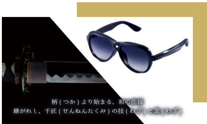
柄(つか)より始まる、和の曲線 継がれし、千匠(せんねんたくみ)の技(わざ)と業(わざ)