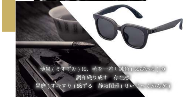
薄墨(うすずみ)に、藍を一差し鈍色(にびいろ)の 調和織り成す 存在感 墨磨(すみすり)感する 静寂閑雅(せいじやくかんが)