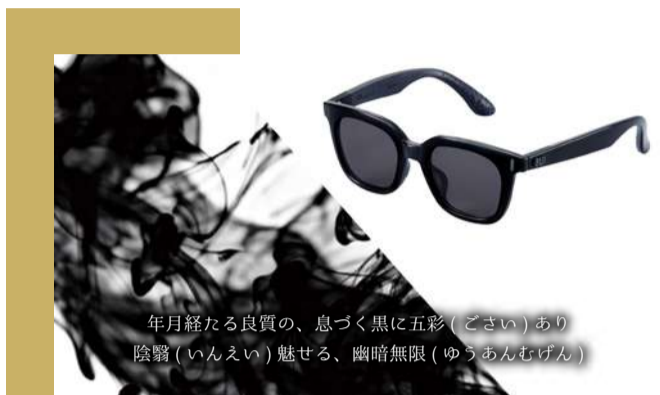
年月経たる良質の、息づく黒に五彩(ごさい)あり 陰翳(いんえい)魅せる、幽暗無限(ゆうあんむげん)

輪郭や色が際立ち、立体感のある景色を演出するレンズは、トンネルや日陰になっても暗さを感じさせない。紫外線を防ぐだけでなく「365日使える」を意識して作られたレンズにもブランドの「こだわり」が息づいている。作るだけじゃなく、それを使う人の生活を考えた上で選び抜かれたレンズだから長く使用しても疲れな。