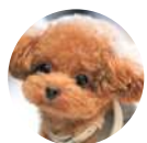
キラキラほしさん

お子さんが花粉症で大変な場合、普段投薬以外にどのような対処法をとっているのか、アドバイスをいただけたら嬉しいです。