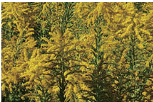
5歳までの発症が4割...