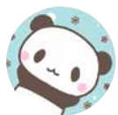
えもえも 0115 さん