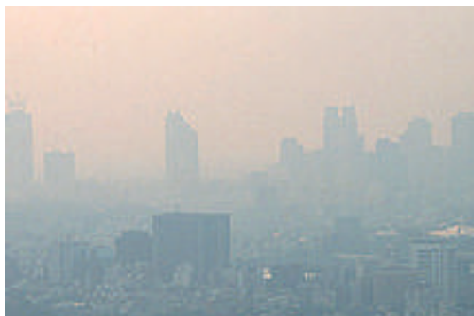
黄砂やPM2.5がアレルギー悪化の原因に...