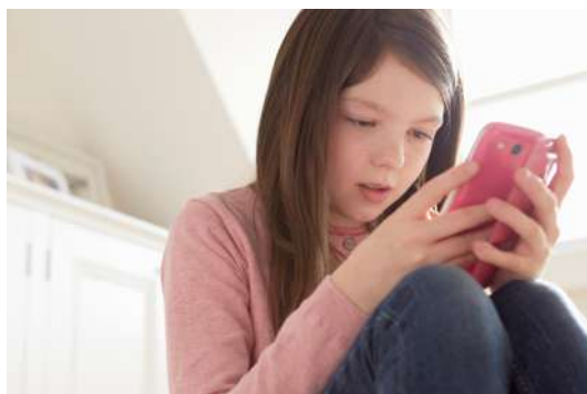
涙不足は潤い不足。 目をこする・目の充血にご用心...