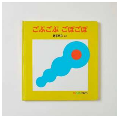
『ゴボゴボ ゴボゴボ』 福音館書店 1999年

本展は、アメリカ時代の実験的な試作から、音楽、ファッションでの仕事、絵本の制作のプロセスがわかるスケッチまで、駒形の初期から現在までの足跡を約 300 点の作品でたどる初めての展覧会です。ユニークな絵本の魅力を立体的にご覧いただけるコーナーも見所のひとつです。