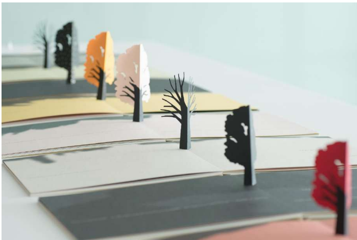
『Little Tree』 ワンストローク 2008年