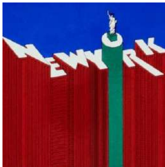
ポートフォリオ用スライド 1976-80年頃

アメリカ時代のグラフィックデザイン。実物は現存しておらず、小さなポートフォリオ用のスライドが残るのみ。