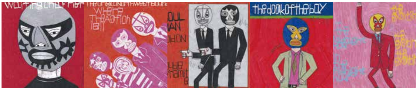
作品: 特定非営利活動法人かうんと5

昭和5年7月に創業した塗装会社です。防水、左官、とび・土工、建具、建築一式、土木一式工事業と許可業種を上げ橋梁、大型鋼構造物、建設物の塗装工事に携わってきました。令和2年7月で90年の実績を活かして、建造物の付加価値を高め、寿命を延ばすための塗装仕様、カビや菌に対しての防カビ抗菌対策の仕様の提案と施工、土木・建築塗装工事全般の施工方法の改良・新規工法の研究開発に努力しています。 https://www.sanotoso.jp/