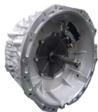
小型 HV モーター

ハイブリッドトラックは、CO2 削減に向けて今後増々需要が伸びる分野であり、弊社の主力製品とするべく組立設備を新規導入し、新田工場内に専用の小型 HV モーター（出力 35 kW）、大型 HV モーター（出力 90 kW）、バッテリーパックの生産ラインを設置し、電動車用の次世代ユニットの生産ラインとして稼働を開始致しました。特に小型 HV モーターラインは、新規技術を駆使し、お客様へ高品質な製品を供給可能な IoT ラインとして整備致しました。（図 1. 参照）