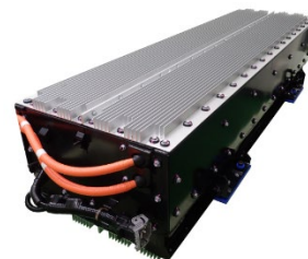
バッテリーパック