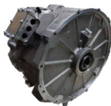
大型 HV モーター