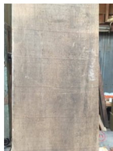
客席カウンター材