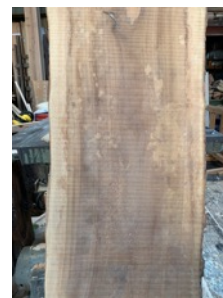
客席カウンター材