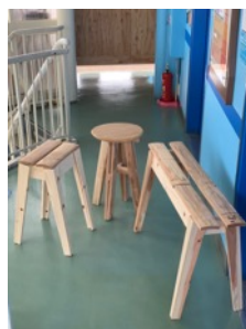
スツール・サンプル