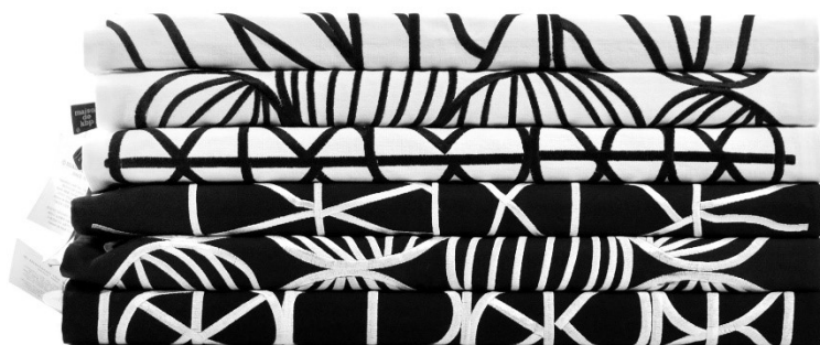
オリジナルファブリックデザイン