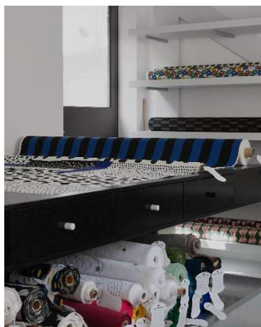
オリジナルファブリックデザイン