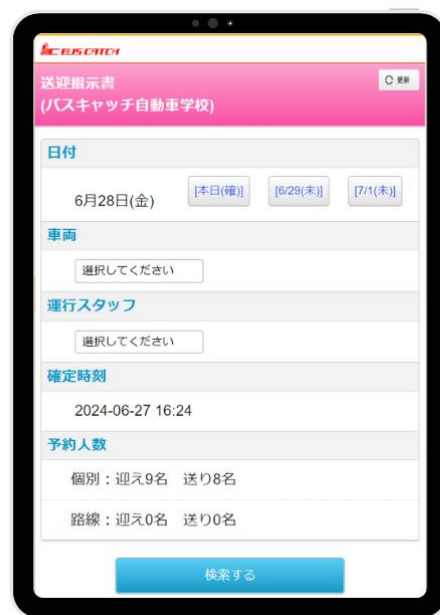
右:ドライバーの送迎指示書