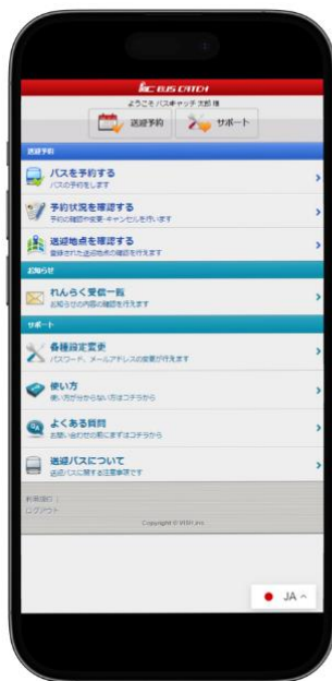
左:教習生のバス予約画面