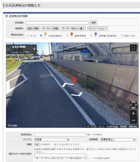
公式送迎地点設定画面

また、乗降場所の見直しにも取り組み、集客に力を入れたいポイントを再設定しました。ドライバーは教習生の自宅近くまで送迎し、人通りが少ない場所での降車を避けるなど、教習生の安全と利便性を第一に考えた柔軟な運用を実施しました。