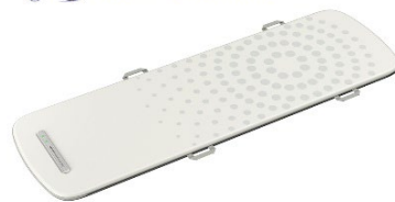
眠りSCAN 見守りセンサー