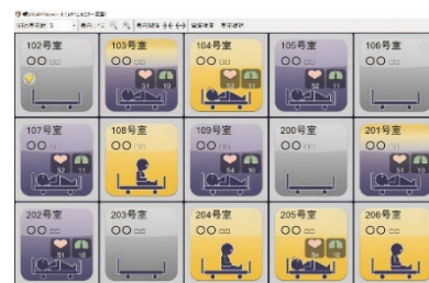
眠りSCAN リアルタイムモニター