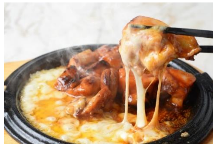
「チーズタッカルビ」