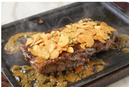
「OH! MY ガーリックステーキ」