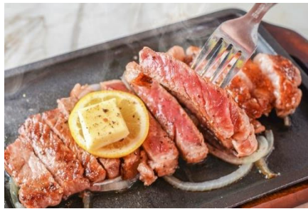
プレミアムプラン限定 「サーロインステーキ」