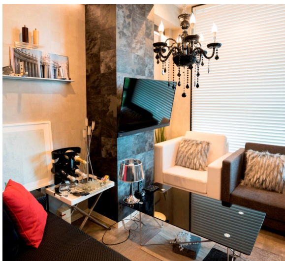
イタリアをイメージした打合せエリア

同社は、カフェやバーのような、居心地がよく遊び心のある、“オフィスらしくないオフィス”の実現を得意としています。新オフィスでは世界5地域のインテリア空間を体験することができます。同社は不動産仲介、デザイン・設計、施工、インテリア、照明などをワンストップで提供することが特長です。顧客は発注の手間がかからず、費用を削減することができ、全体の統一感を確保できるというメリットがあります。