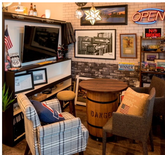
ニューヨークをイメージした打合せエリア

新しいショールーム型オフィスが「エアライン」をテーマにしているのは、エアラインが、様々なスタッフの協力によって、お客様を安全・快適に目的地に到着させるように、同社では様々なスタッフが協力して、お客様が望む空間デザインを実現(目的地に到着させる)するということを表現しています。