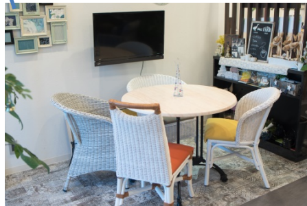
フランスをテーマにした打合せエリア