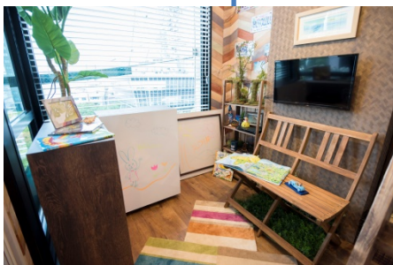
ハワイをテーマにした打合せエリア