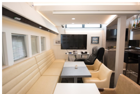
旅客機のファーストクラスをイメージしたラウンジ

新オフィスでは世界のインテリア空間旅行を体験することができます。訪問したお客様は、海外5地域(ニューヨーク、ハワイ、フランス、イタリア、北欧)をテーマにした打合せエリアに到着します。各エリアではテーブル、椅子、照明、壁紙、小物により、それぞれの地域のインテリア空間を演出しています。また、ラウンジは旅客機のファーストクラスをイメージしています。執務エリアはスタッフがコミュニケーションをとりやすく、立ったままカタログ閲覧や打ち合わせができる作業台も設置されており、機能的です。