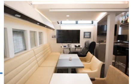
ファーストクラスをイメージしたラウンジ