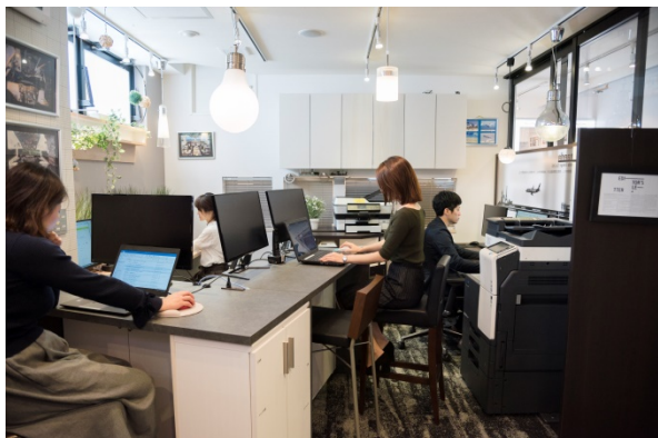
執務エリアはスタッフがコミュニケーションをとりやすい

すでに新オフィスを訪れた人には、「こんな雰囲気がいい」と空間デザインの参考にした人や、「堅苦しくない雰囲気で、リラックスして話すことができた」という感想を話した人もいます。新オフィスは同社の社員全員で意見を出し合って実現したため、社員からの評価も高く、社員からは「おしゃれで働きやすい」、「トイレも居心地がいい」、「会社のブランドイメージが上がった」などの感想があり、社員のモチベーションアップにも効果があるようです。