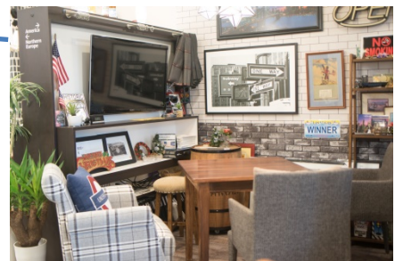
ニューヨークをテーマにした打合せエリア