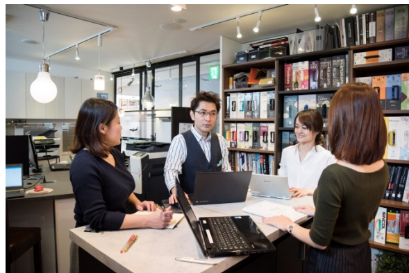
立ったままカタログ閲覧や打ち合わせができる作業台