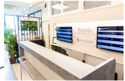
空港のカウンターをイメージした受付