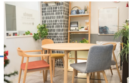
北欧をテーマにした打合せエリア