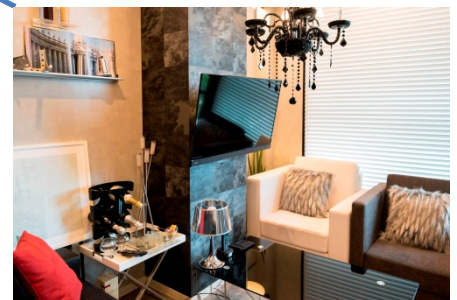
イタリアをテーマにした打合せエリア

【ご取材等お問い合わせ】 株式会社 Imaeda Design 広報窓口 (株式会社インフォデザイン 門脇)