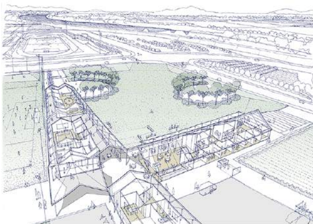
完成イメージ図(外観)

一般社団法人熊本県サッカー協会（以下KFA）にはキッズからシニア年代まで約500チーム・選手17,000人余が登録しています（2021年7月7日現在）。一方で県内グラウンド数が少なく、慢性的な公式戦会場不足の状態にあります。2022年8月開設予定の官民連携事業による「熊本県フットボールセンター（仮称、以下フットボールセンター）」は、そうした状況の解消に加え、県サッカー界の強化育成拠点として開設されます。