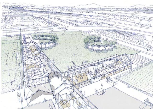
完成イメージ図(外観)

2022年8月開設予定の官民連携事業による「熊本県フットボールセンター（仮称、以下フットボールセンター）」は、そうした状況の解消に加え、県サッカー界の強化育成拠点として開設されます。ナイター照明付き人工芝サッカーフィールド2面のほか、更衣室・シャワーを備えたクラブハウス、400台収容可能な駐車場を完備し、さらに芝生広場、保育園、カフェ、ランドリーなどその他様々な施設を併設します。