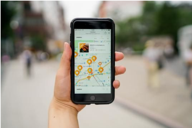
お客様利用イメージ