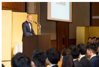
内定者に向けて話す清川社長