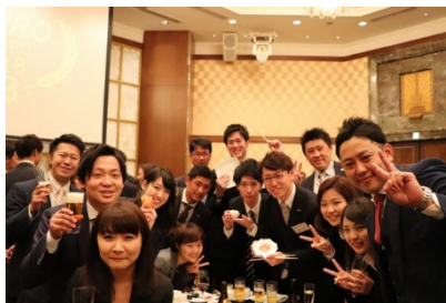
内定者も一緒にアワードに参加