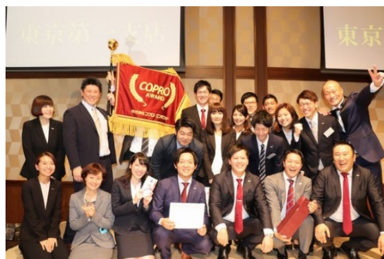
支店 MVP の受賞

「コプロアワード」とは、全国13拠点の社員(187名)が一堂に会し、個人や支店の成績を個人15部門、支店2部門で表彰するイベントです。今回で24回目の開催となり、当社の全社員・全支店は日々、アワードの受賞を目指して努力しており、受賞に歓喜して涙を流す人、受賞を逃して悔し涙を流す人が続出します。内定者は、そのような先輩方の姿を目の当たりにすることで、働くイメージや「あの先輩のようになりたい」という目標を持つことができ、また、支店の雰囲気を知ることで入社前の不安を減らすことを目的としています。また、社長自らが社員に感謝を伝える姿や、受賞者が仲間同士で感謝しあう社風を見て、「この会社の一員として働きたい」という気持ちが後押しされることが期待されます。