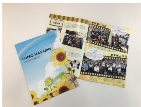
内定者広報誌(7月号、8月号)

当社では内定辞退を防ぐ取り組みの1つとして、内定者限定の社内報を7月から12月まで毎月発行しています。同期の紹介や会社の雰囲気伝えることで、同期との連帯感や入社後の働くイメージを持ってもらうことを目的としています。