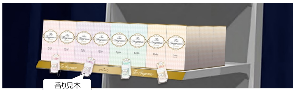
現状の香り見本のついた商品棚イメージ

また現状の香り見本は、製品の香りを基材に付した容器が設置されている形が一般的であり、視覚と連動した店頭訴求等が行われていません。さらに消費者が手にとって利用するタイプが主流であるため、消費者の接触、取り扱いに起因する破損容器の交換や、メーカーごとの香り見本の管理など、小売店の手間が生じています。