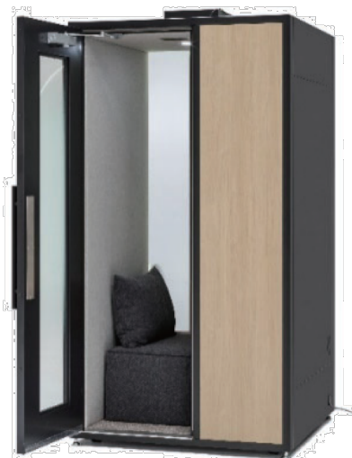
診療ボックス（オリバー製）

様々な医療機器と接続し、バイタルデータを収集、わかりやすいダッシュボード表示で診療に活用 健康サポートアプリとの連携による患者様のライフログ取得で、患者様の状態把握に活用