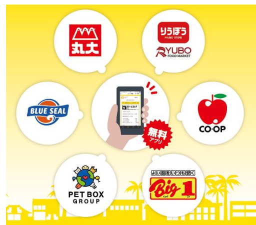
「プロジェクト参加企業」