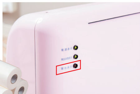
▲交換時期は警告灯と警告音でお知らせ