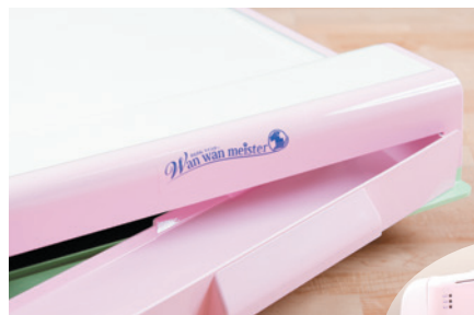
▲はいせつボックスの取り出し、お掃除も簡単！

はいせつ物と専用シーツのコントロールは独自開発の高感度センサーで行います。愛犬のはいせつ終了後、降りて5秒後にゆっくりとロールアップを始めます。また、途中で戻ると感知して一度止まり、シーツ上に居ない事を確認後再稼働します。シーツは残り約3メートルで警告灯が点灯し警告音も鳴るので交換時期を目と耳でお知らせします。