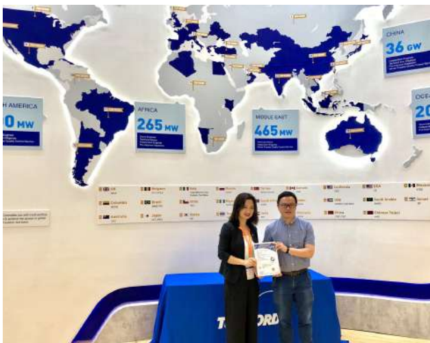
▶TUV NORD証明書を受け取る

また今回の展示会では、ドイツの第三者検査機関であるTUV NORDがすべての企業に最新の証明書を発行しました。当社は166セルモジュールの証明書を正式に受領し、海外市場向けに最大出力455Wのモジュールの量産を開始しています。