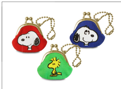
ミニがま口ストラップ / 1,595円 ボールチェーンが付いたミニチャーム。小銭入れやアクセサリ、薬などの小物入れとして使えます。3色展開。