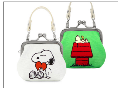
革ヒモ付き手提げがま口財布(小) / 2,860円 表と裏どちらも楽しめるデザイン。取り外し可能な持ち手付きで、バッグに提げて鍵や常備薬などの小物入れとしても使えます。2色展開。