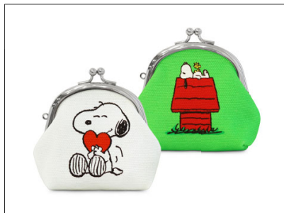
くし型がま口おすわりポーチ / 1,980円 表と裏どちらも楽しめるデザイン。手のひらサイズの小さなポーチ。自立するのでお部屋に飾ることもできます。2色展開。