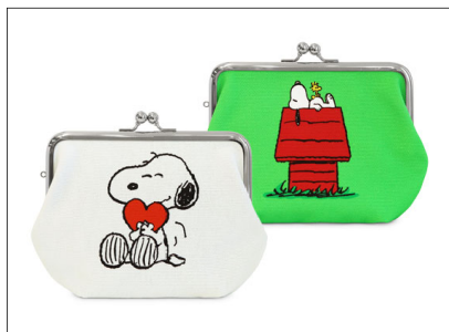
5寸がま口スッキリポーチ / 3,630円 表と裏どちらも楽しめるデザイン。バッグインにちょうどいいスリムなポーチ。コスメポーチはもちろん、ガジェット入れにもおすすめ。2色展開。