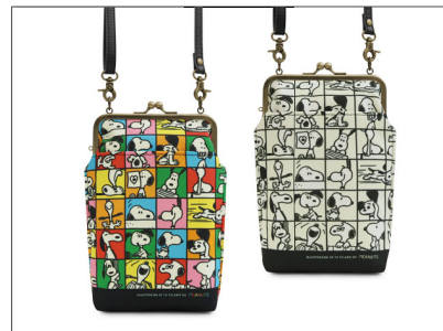
がま口お散歩ポシェット / 6,490円 ぶらっとお散歩にぴったりな小さめポシェット。外と中に小物の仕分けに便利なポケットが1つずつ付いています。2色展開。