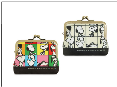
3.5寸角丸がま口コインケース / 2,860円 手のひらサイズの三つ折りのお札が入るミニ財布。カードや小銭の仕分けに便利な内ポケット付き。ミニポーチとしても使えます。2色展開。