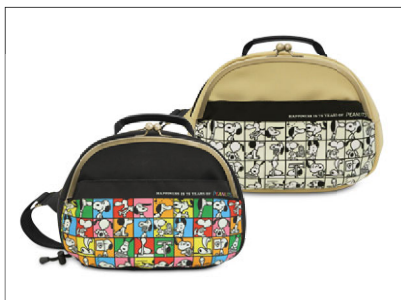
がま口ポシェット型ボディバッグ / 19,800円 丸いフォルムが特徴の500mlボトルや長財布も入る容量たっぷりのバッグ。2種類の外ポケットや内ポケット、ボトルホルダー付き。2色展開。