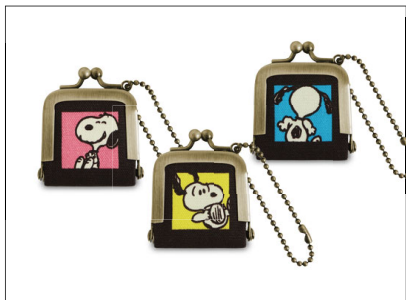
スクエアがま口ストラップ / 1,595円 ボールチェーンが付いたミニチャーム。500円玉が2枚入るサイズ感。もしもの時のための非常金入れとしてもおすすめです。3色展開。