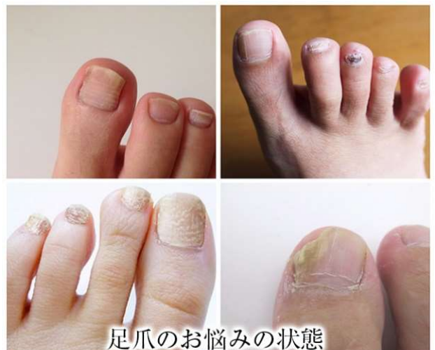
足爪のお悩みの状態

しかしながら、爪の表面には「親油性」の膜があり、油に馴染みやすい特性があります。『クリアネイルショット アルファ』はこの特性を活かすため、オイルでアプローチ成分を包み込むことで爪に馴染みやすくすることができる「浸透力特化製法」を採用しています。これにより、今までよりも爪の悩みにアプローチすることが可能になったのです。