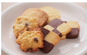
いこま福祉会様 お菓子