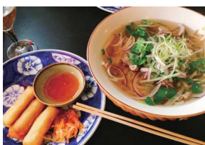
ベトナム料理販売