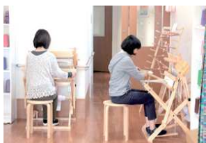
さおり織り体験・販売