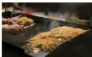
焼きそば・焼き鳥・ゲーム等