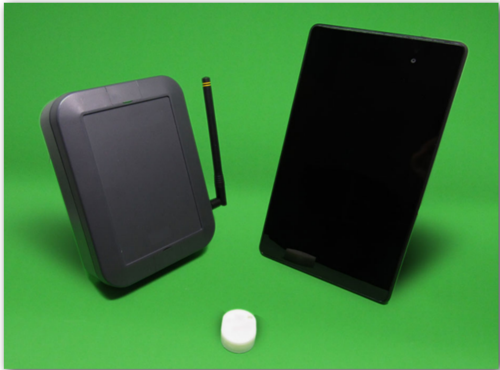
さがし愛・見守りセット TAIS：01717 - 000002

さがし愛ネットは、産業交流展2017（11月15日～17日）に出展します。 今回の展示では、介護保険適用を受けた認知症徘徊・見守りセット、地域IoTソリューション・見守りテラス、生涯現役アプリなどを出展します。 是非この機会に、さがし愛ネット（西3ホール・医-5）ブースにお立ち寄り下さい。