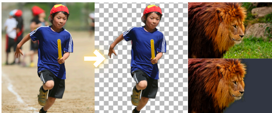
背景削除を自動実行した例

写真の編集時に手間と時間のかかる背景切り抜き（白抜き）もAIが自動処理します。自動的に別の背景と合成をしたり、透過PNGとして保存することができます。