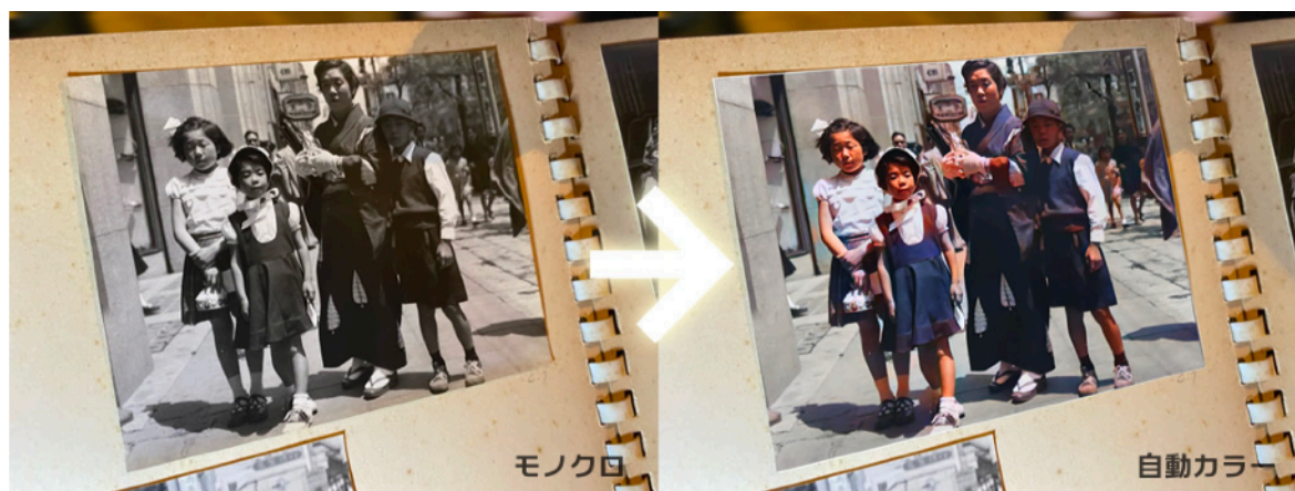
カラー化(色付け)、顔補正、色修正を自動実行した例

昭和の時代にタイムスリップしましょう！「AVCLabs Photo Enhancer AI」なら、白黒写真をカラー写真に変換することもできます。カラー化すれば、画像のみならず、当時の記憶も鮮明に蘇ること間違いなし！高解像度で保存できるので、画像を大きくプリントすることも可能です。