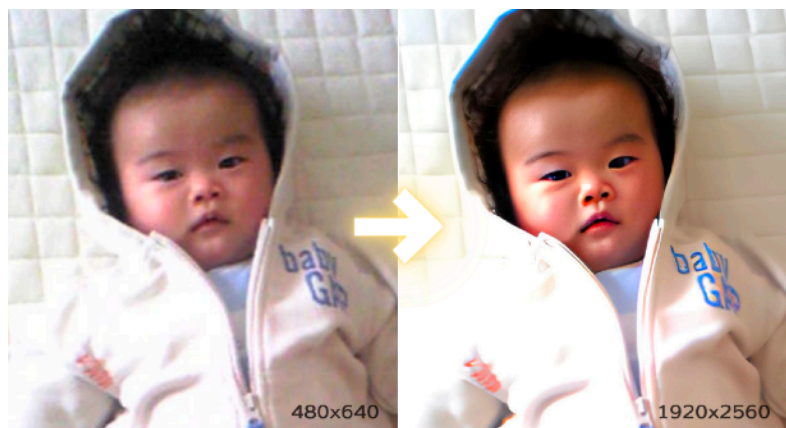
400%高解像度化し、顔補正＋ノイズ除去＋色修正を自動実行した例

ピンボケした画質の粗い写真や、素材として使うには解像度の足りない写真やイラストなどを高画質に変換することができます。何十年も前に撮影したフィルム写真がまるでデジカメで撮影したかのような写真に、初期のデジカメや携帯電話（ガラケー）で撮影した低画質写真や、Web上の低解像度画像が、驚くほど鮮明な画像に生まれ変わります。