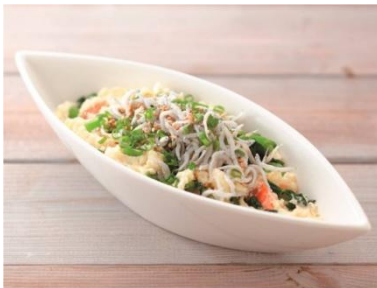
関東「おいしいじゃん！ しらすと小松菜のポテトサラダ」