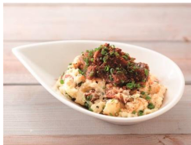
関西「めっちゃうまいやん！ ほっかけポテトサラダ」