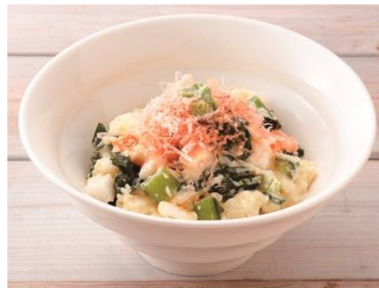
信越「えれうめえな！ わさびと野沢菜のポテトサラダ」