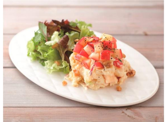
3位：東北「まんずんめなあ〜！ りんごのデザート風ポテトサラダ」