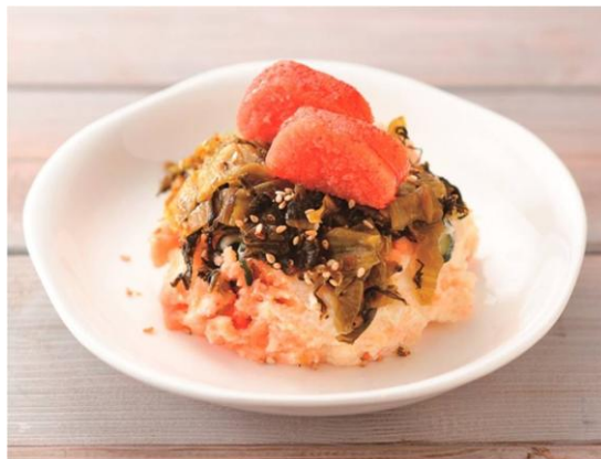
1位：九州「バリうま！辛子明太子と高菜のポテトサラダ」

投票の結果、 ご当地ポテトサラダ1位に輝いたのは、九州の「バリうま！辛子明太子と高菜のポテトサラダ」 。辛子明太子のピリッとした辛さと高菜の食感が非常にマッチした一品です。ご飯のおかずにも、お酒のおつまみとしても楽しめる万能ポテトサラダです。