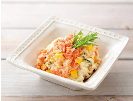
2位：北海道「なまらうまい！ 鮭を味わうポテトサラダ」