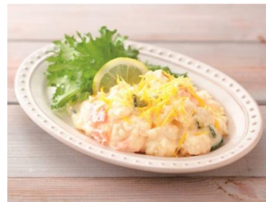
中四国「ぶちうまいけえ！ レモンの 爽やかポテトサラダ」