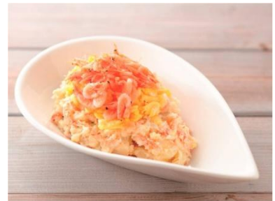
中部「うまいら〜！ 桜えびの 香ばしポテトサラダ」