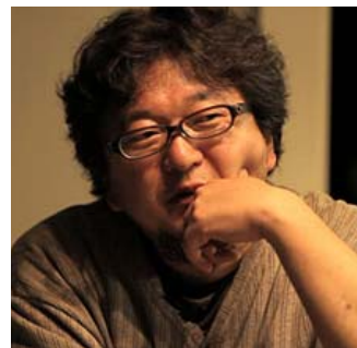
特技監督・映画監督・映像作家・装幀家 樋口 真嗣 氏