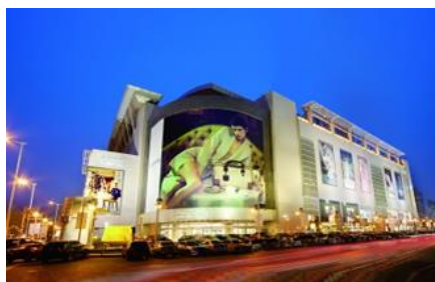
天津海信広場(天津市)