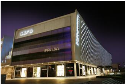
青島海信広場(山東省青島市)