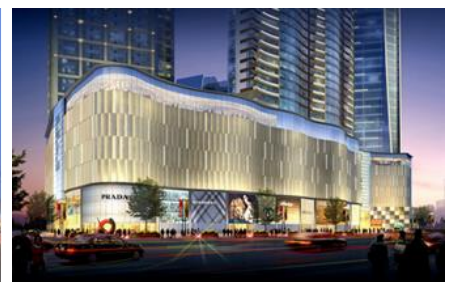
長沙海信広場(湖南省長沙市)