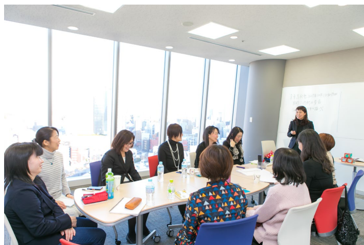
写真：セルフマネジメント講座の様子

「ことはない」が過去最高(29.3%)、「働く目的」では「楽しい生活をしたい」が過去最高を更新(42.6%)し、「自分の能力をためす」は過去最低を更新(10.9%)、「社会に役立つ」も減少傾向(9.2%)。