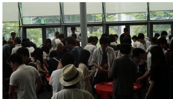
オーディエンスの交流プログラムの様子

オーディエンスは、協賛企業関係来賓、大学関係来賓、一般申込者を含めておよそ100名。プレゼンテーションの合間に、オーディエンスどうしの交流プログラムが企画され、意見交換がなされました。