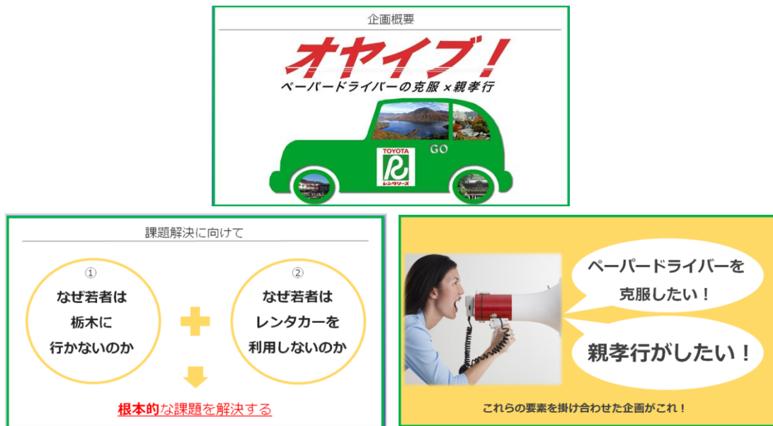
大学生による実際の企画書（一部抜粋）