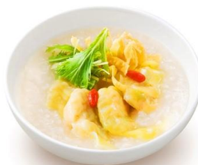
※2「ぷりぷり海老わんたんのおかゆ」：289kcal