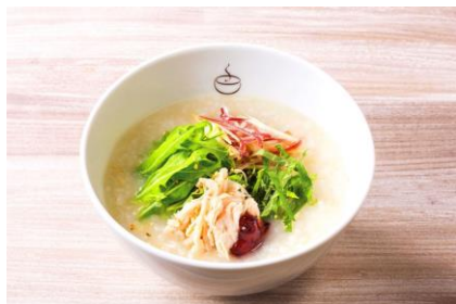
※1「蒸し鶏とみょうがのおかゆ梅味仕立て」：172kcal

玄米かゆは白米に比べビタミンB1が7倍、食物繊維が6倍も多く含まれ、栄養豊富で低カロリー。白米に玄米をブレンドした「粥餐厅」のレギュラーメニューのおかゆは、172kcal（※1）から最大でも289kcal（※2）。おかゆの他にもう少し食べたい時や、食後のデザートとして、おいしく両方楽しめてカロリーは合計386kcal～503kcal（プレーンのバナナシェイク214kcalとおかゆの合算カロリー）。低カロリーで日々不足しがちな食物繊維をおいしくたっぷり摂ることができる健康への新たな組み合わせを「粥餐厅」はご提案します。