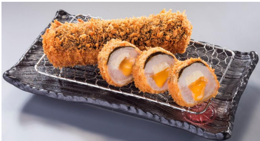
『金洋丸』 ヒレ&ロースとこだわりチーズが口の中で融合する個性豊かな一品

4月14日より販売を開始する『金洋丸（きんようまる）』は、1974年（昭和49年）に大人気だったメニューの復刻商品。三元麦豚のロースとヒレで、爽やかなクリームチーズとコクのあるチェダーチーズを巻いたボリューム満点の棒巻きかつです。後からふわっと香る海苔の風味がアクセントとなり、贅沢な食材を一度に楽しめる、「とんかつ新宿さぼてん」ならではのオリジナルメニューです。