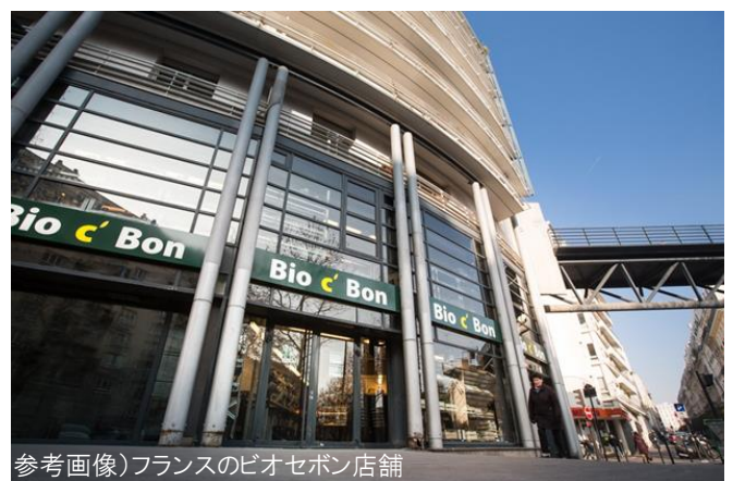
参考画像)フランスのビオセボン店舗

ドットエヌのシャンプー&トリートメントは、オーガニック認証を取得した日本初のヘアケアという点が高く評価され、日本のヘアケアブランドとしてセレクトされ、店頭に並びます。