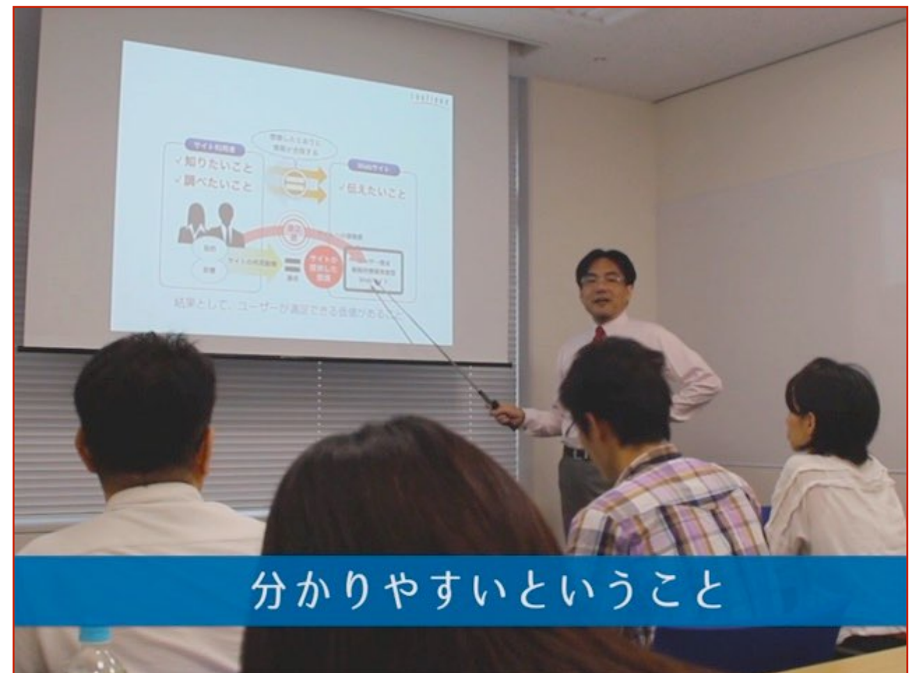
●テストセミナーの講習風景