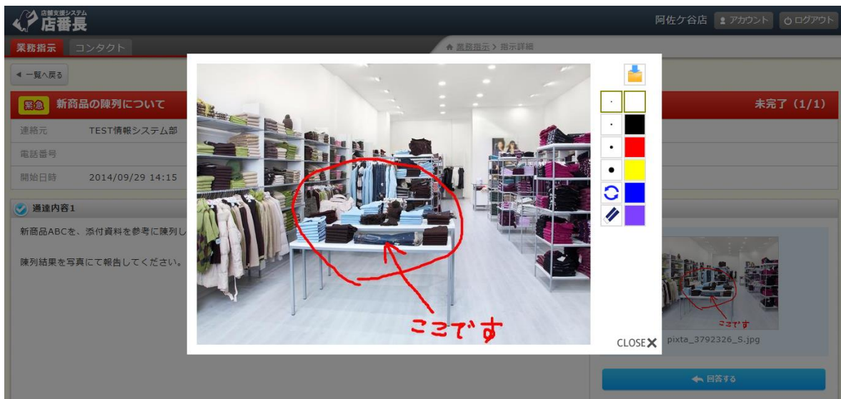
図. 店番長の報告写真に加えられた手書きコメント