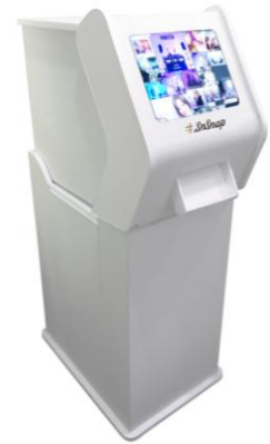
SNS フォトプリンター「# SnSnap」