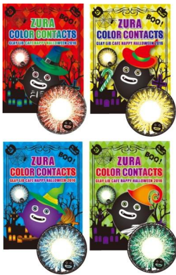
「GLAY LiB CAFE ZURA カラーコンタクト」 カラーラインナップ

カラーコンタクト単品での発売（価格：税抜2,300円）のほか、数量限定のプレミアムセット（セット内容：カラーコンタクト2箱（同色）・限定オリジナル「ZURA」ミラー・限定オリジナル「ZURA」巾着・ケース付き保存液、価格：税抜6,900円）も展開いたします。