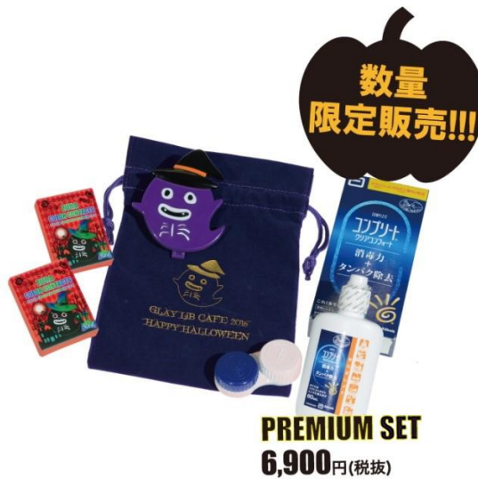
「プレミアムセット」 商品画像