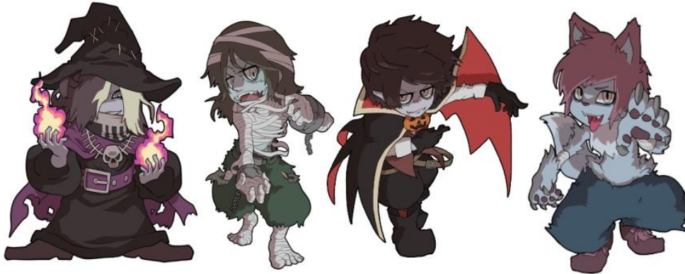
GLAY メンバー ハロウィン仕様イラスト