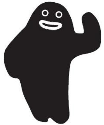
GLAY オフィシャルグッズ等でおなじみのキャラクター「ZURA」