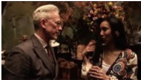
Ms Renalは番組でasahiをつけました。

その姿にインスピレーションを受け、 Scilla. S デザイン、 この世に生まれました...」