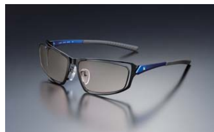
(写真 2)：ブラウン / DetonatioN Blue

(*1): 2016年4月に弊社が発売したLeague of Legends用のゲーミンググラスにはワインレッドのレンズを採用しています。