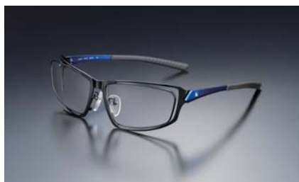
(写真 1)：グレー / DetonatioN Blue

今回、追加されたレンズカラーはグレーとブラウンの2色。既存のレンズカラーであるワインレッド(*1)と同様、新色レンズカラーも DetonatioN Gaming(*2)の選手と共同開発しました。ゲームジャンルごとに異なる画面の色彩の特徴を考慮し、見やすさを追求した結果、FPS(*3)向けにグレー、格闘ゲーム向けにブラウンのレンズカラーを新たに採用いたしました。グレーはFPSだけでなく、長時間のパソコン作業をする方にも推奨しています。(*4)