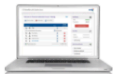
パソコン用ソフトフォン