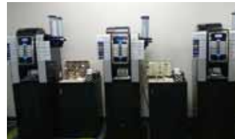
コーヒーサーバー (午前中利用可能)