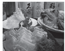
日本酒しゃぶしゃぶ