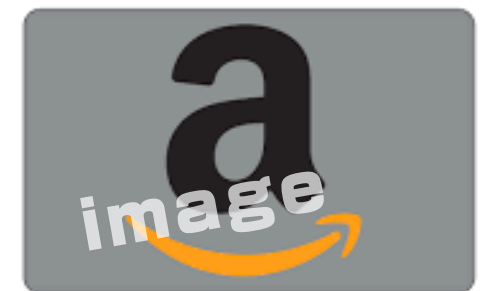
▲パッケージは入賞イラストを予定