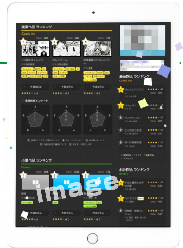
▲結果をグラフとランキングで表示