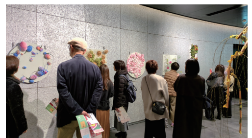
2023 年「いけばな龍生展」（渋谷ストリーム ホール） 展示風景より