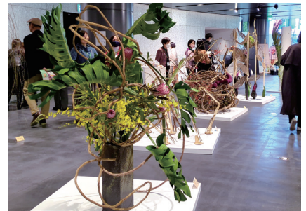
2023 年「いけばな龍生展」（渋谷ストリーム ホール） 展示風景より

龍生派のいけばな展の特徴とも言えるコーナー展示。壁にかけるパネル状の作品、窓辺を彩る作品、そして直径 30 センチ、高さ 2 メートルの紅白 2 種の目に鮮やかな柱を取り掛かりにする作品の並ぶコーナーも。また、下からの照明の光を受けて幻想的に浮かび上がる作品も登場。室町時代にそのルーツは遡る「立華（りっか）」や、江戸時代に町人の間でも広がった「生花（せいかに）」といった、伝承の古典華も様々な手法のものをご覧ください。