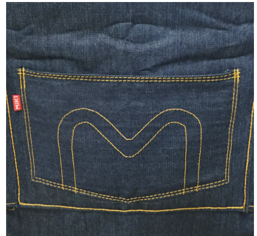
遊び心あふれる背面ポケットデザイン