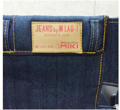
ジーンズならではのこだわりパッチデザイン