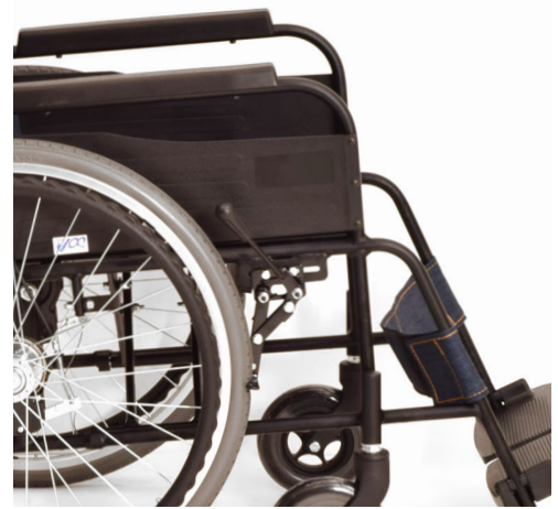
スタイリッシュなマットブラックのフレーム